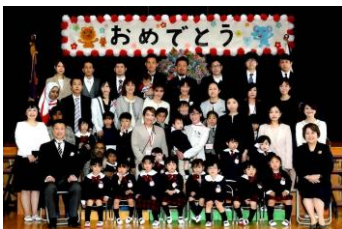
<年少 ちゅうりっぷ組>