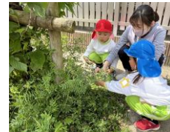
<年中・年少組 いっしょに>