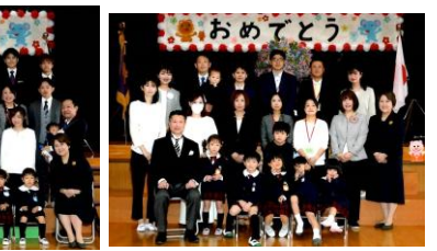
<年中 うめ組、年長 ひまわり・もも組>