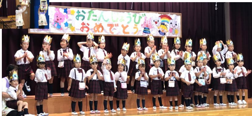
< 5/31 お誕生日会 (4/5/6月) >