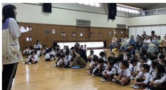
三年ぶりの全体会