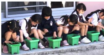
< 5/10 年長組 種まき >

さらに、食事の前に手を洗ったり、遊びの後にお片づけをしたりするルーティンには、他の人との関わりや協力が求められることから、社会的な期待やルールを学び、自分自身や他者との関係を構築することができ、自己管理や協力の意識が育まれます。