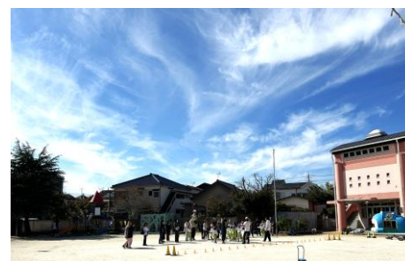
<11/4 巻雲（けんうん）又はすじ雲>

園も子どもたちにとって、もうひとつの「しあわせの居場所」でありたいと願っています。安心して自分を出せる場、挑戦しても大丈夫と思える場、そして「だいすき」と言える人がそばにいる場。そんな温かな空間を、私たちはこれからも丁寧に育てていきます。遠くを探さなくても、しあわせはいつも、私たちのすぐそばにあります。子どもたちの笑顔がその証です。園とご家庭が心を寄せ合いながら、そのしあわせの居場所を一緒に守ってまいりましょう。