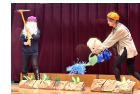
「大きなかぶ」を披露